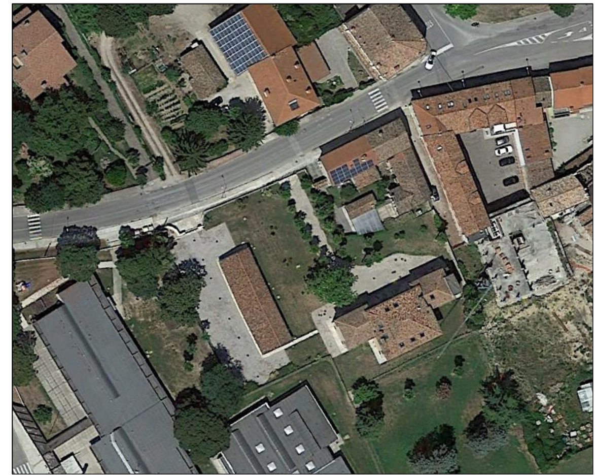
Stralcio Foto aerea dell'area di cantiere Scala 1:1'000